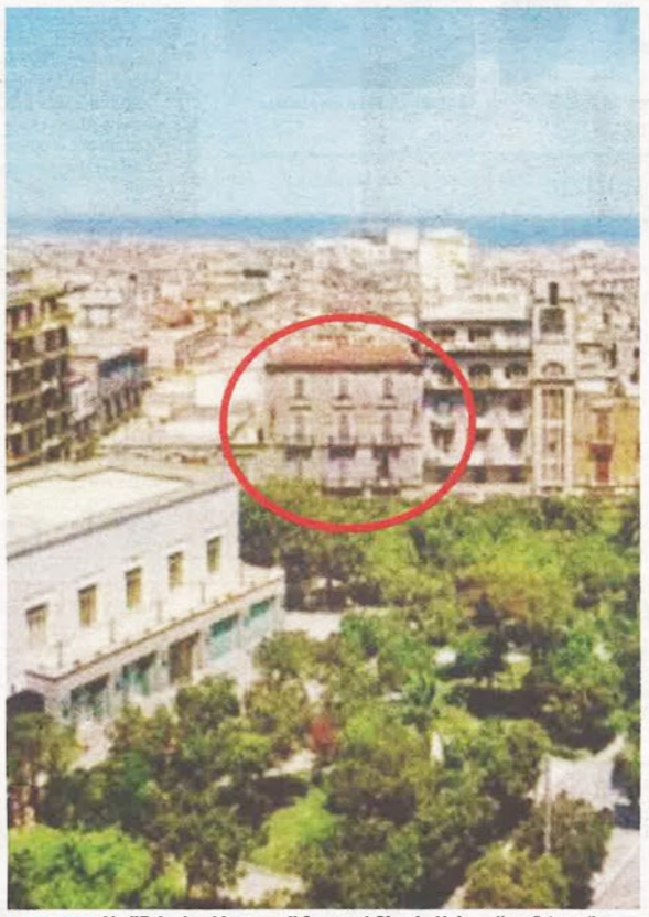
BARILETTA L'edificio da abbattere di fronte al Circolo Unione

Il «manifesto» redatto dai giovani architetti e ingegneri di Barletta