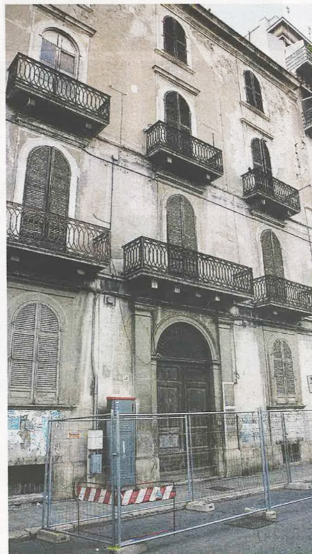
BARILETTA Palazzo Tresca

SCAGLIARINI A PAG. 7 DEL FASCICOLO NAZIONALE >>