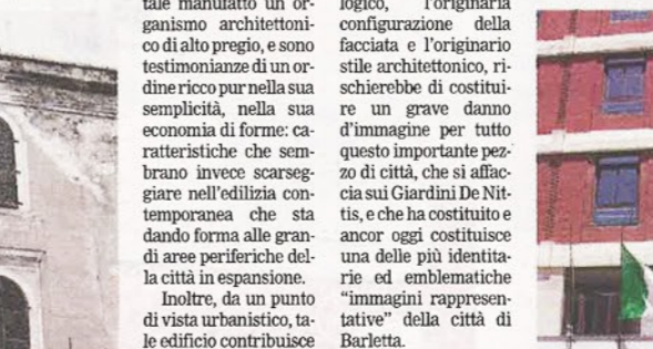
Palazzo di Città

presentando 4 livelli in luogo dei 3 iniziali, viene «corretta» mediante l'uso di lesene «giganti» che accorpano gli ultimi due livelli.