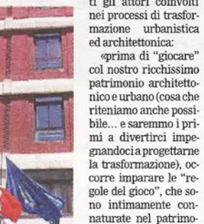
Palazzo di Città

periodo dello sgonfiamento della «bolla immobiliare». A fronte, invece, della possibilità di recuperare anche più del 50% della spesa necessaria al più semplice restauro dell'edificio attraverso finanziamenti, agevolazioni e detrazioni. In quest'ottica, l'edificio potrebbe comunque ammodernarsi, pur mantenendo i suoi principali caratteri estetici e le tracce che lo connotano come importante testimonianza storica barlettana, e tale postura porterebbe dunque a un maggiore successo immobiliare e di immagine.